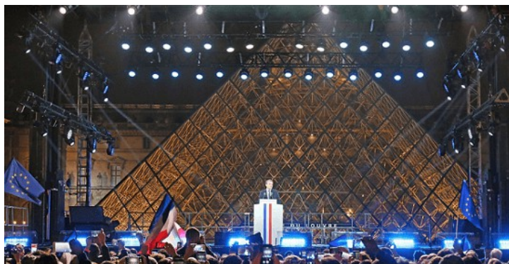
Mars 2018: l'actuel président français Emmanuel Macron, devant la Pyramide du Louvre, le soir de son « élection » en 2017.